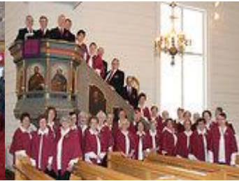
Kuoro Pieksämäen Vanhassa kirkossa